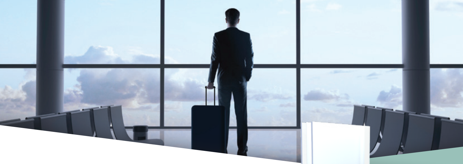
Lámina de PVB Saflex® Acoustic

Nuestra gama de productos acústicos reduce el ruido percibido en hasta un 50 %.